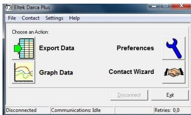
Obr. 1.1: Výchozí obrazovka programu Darca Plus

Prvním krokem v tomto měření tedy je rozmístění měřicích čidel podle pokynů vyučujícího. Poté se zapne napájení centrální jednotky pomocí připraveného napájecího adaptéru (pokud nejsou baterie dostatečně nabity). V počítači se spustí software Darca Plus. Výchozí obrazovka je znázorněna na obr. 1.1.